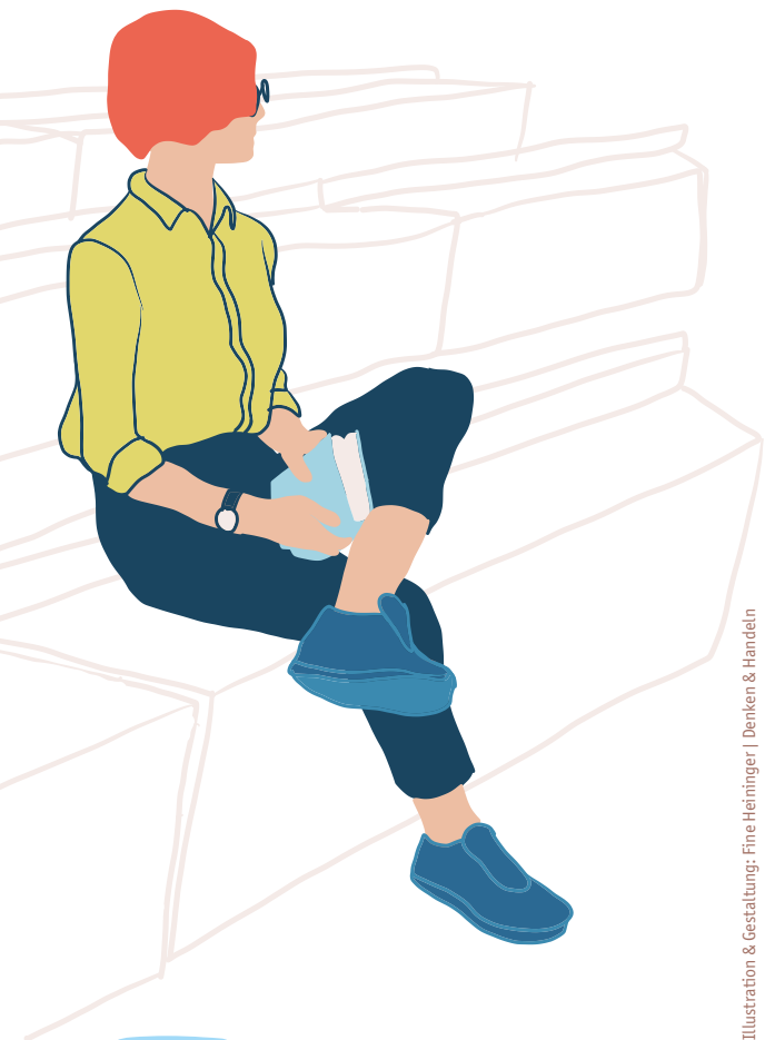
Illustration & Gestaltung: Fine Heininger | Denken & Handeln