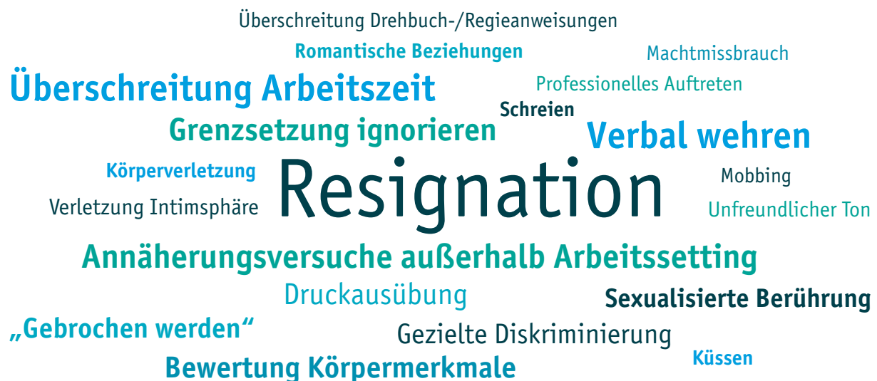
Abbildung 2: Themenwolke Grenzen und Grenzüberschreitungen (Schriftgröße spiegelt Häufigkeit der Nennung wider)

Alle befragten Personen konnten aus eigener Erfahrung oder der Erfahrung Dritter von verschiedenen Formen grenzüberschreitenden Verhaltens berichten.