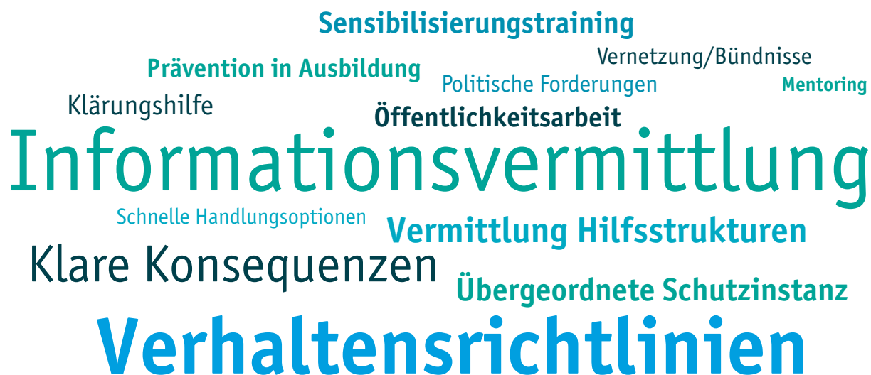
Abbildung 4: Themenwolke Wunsche und Empfehlungen (Schriftgröße spiegelt Häufigkeit der Nennung wider)

Im Rahmen der Expert*inneninterviews wurden abschließend Wünsche in Bezug auf Schutz- und Unterstützungsmaßnahmen für Betroffene sowie Visionen für einen Kulturwandel in der Branche erfragt. Der resultierende Empfehlungskatalog lässt sich in die Bereiche Prävention sowie Interventionen/Verbesserungen auf institutioneller Ebene unterteilen (Überblick siehe Abbildung 4). Im Fokus stand insbesondere die Notwendigkeit der Vermittlung von Informationen und Entwicklung klarer Verhaltensrichtlinien im Umgang mit Grenzüberschreitungen jeglicher Art.