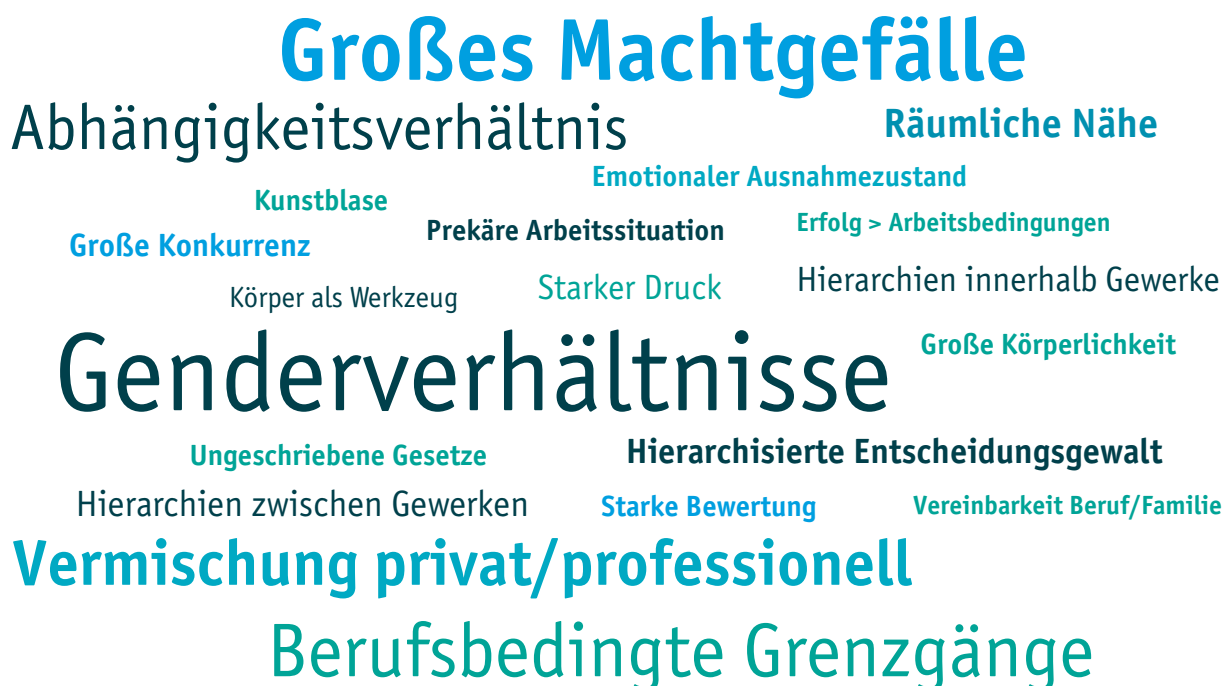
Abbildung 1: Themenwolke branchenspezifische Besonderheiten (Schriftgröße spiegelt Häufigkeit der Nennung wider)