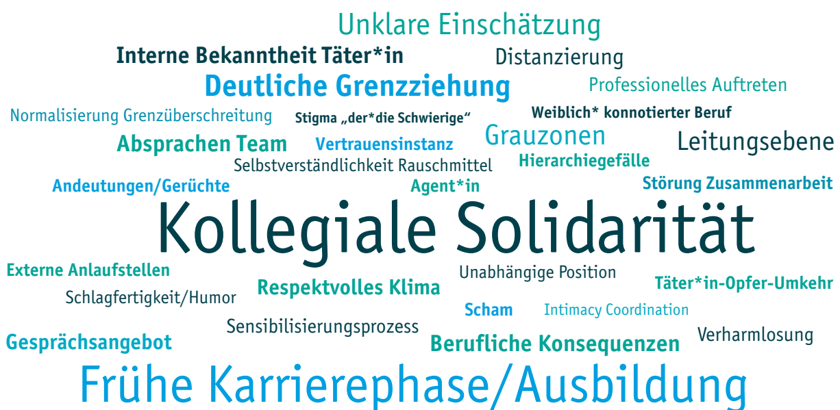
Abbildung 3: Themenwolke Umgang mit sexueller Belästigung (Schriftgröße spiegelt Häufigkeit der Nennung wider)

Wie reagieren auf sexuelle Belästigung? Wer oder was kann helfen? Was hält davor zurück, sich zu wehren oder offizielle Beschwerden einzulegen? Als hilfreiche Reaktionsstrategie bei sexueller Belästigung und sexualisierten Grenzüberschreitungen wurde neben verbaler Grenzziehung das Einholen sozialer Unterstützung – vonseiten des Teams, der Leitungsebene oder beratender Einrichtungen – genannt. Von zentraler Bedeutung für das Einholen interner Unterstützung sei eine respektvolle Kultur kollegialer Solidarität. Es gäbe auch einige teils existenzielle Hürden und Befürchtungen, die einer Beschwerde oder auch nur einem Hilfesuch im Wege stünden. Besonders gefährdet seien aus Sicht der befragten Expert*innen Personen, die sich in einem frühen Karrierestadium oder noch in Ausbildung befinden (siehe Abbildung 3).